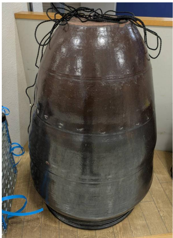
17 . かめ 2,000 円