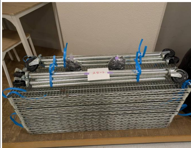
16 . スチールラックセット 5,000 円